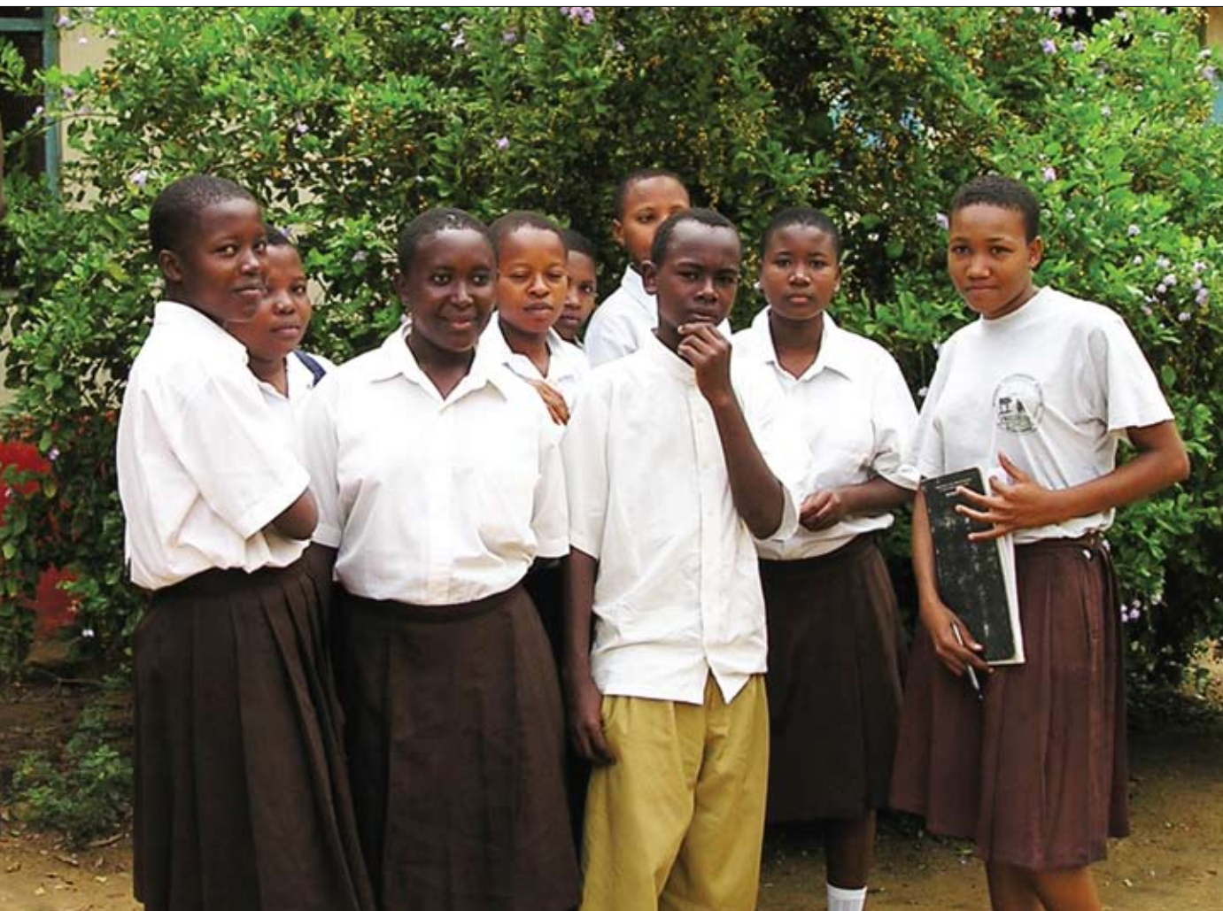
Eleverne på realskolen i Mombo er advaret mod smittefaren ved HIV. De indrømmer, at de har kærestes, selv om det er forbudt på skolen.

Fordi de alle var indflydelsesrige personer i landsbyen, var det nemt mellem kurserne at samle hele befolkninger på mellem 2.500 og 10.000 personer til møder om sagen. Mellem møderne gik disse nøglepersoner rundt i hytterne og informerede og advarede de enkelte familier.